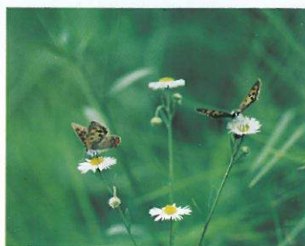
ヒメジョオンとベニシジミ